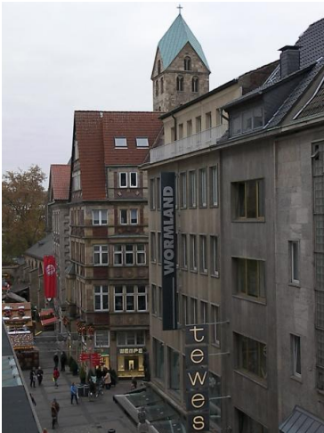
■ Die Nachbarn - Links