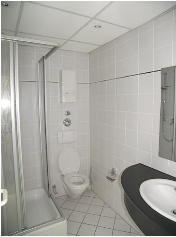
■ mit Duschbad