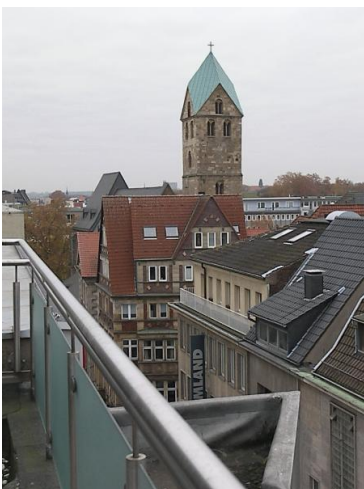
■ vom Balkon