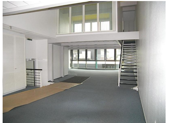
■ Südseite mit "Penthousebüro"