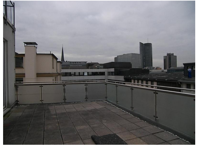
■ die Dachterrasse - Sonne pur