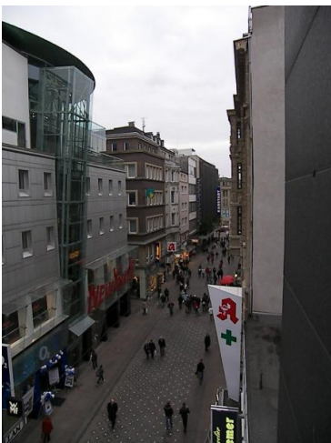
■ Die Nachbarn - Rechts